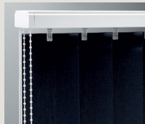
Lina och kulkedja.