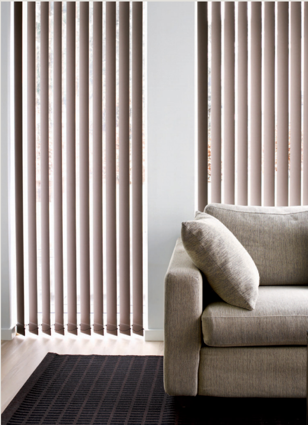
Maxbredd 700 cm / Maxhöjd 400 cm.

Reglering av lamellgardinen går att göra med lina/kulkedja/dragstav eller med motor och då även komplettering av styrning via app.